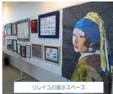
ソレイユの展示スペース