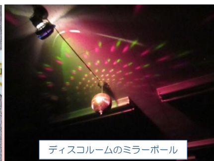
ディスコルームのミラーボール