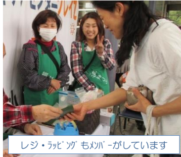
レジ・ラッピングもメンバーがしています