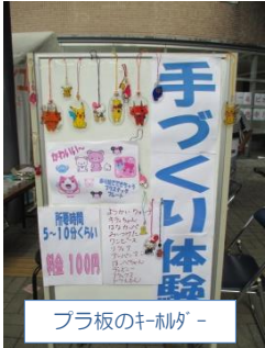
プラ板のキーホルダー

H28年10月23日(日)小川町福祉まつりに参加しました。毎年新品に頭を悩ませていますが、革細工やビーズ手芸、陶芸品のバザーでは、お客さんが手に取って色や形に悩みながら購入してくれる姿を目の当たりにすると、接客やレジ、ラッピング係り全員の手に力が入ります。メンバーそれぞれの活躍が際立った一日となりました。