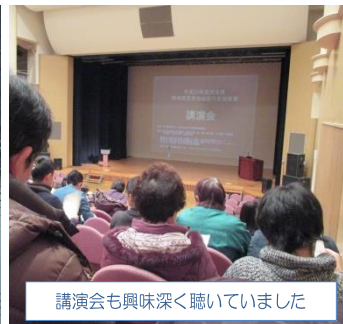
講演会も興味深く聴いていました