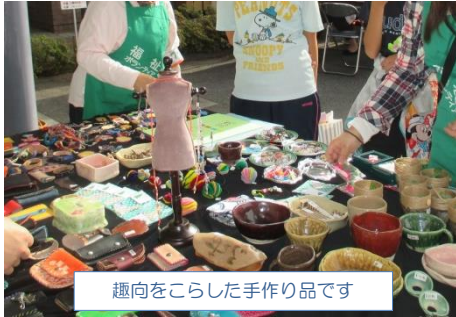
趣向をこらした手作り品です