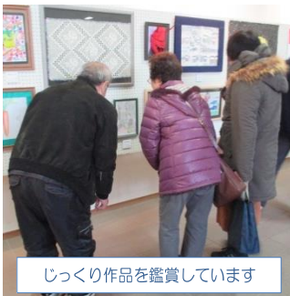
じっくり作品を鑑賞しています

H28.12.1(木)~4(日)ときがわ町のアスパアたまがわで開催されるルビも参加しました。比企地域8市町村で毎年開催地を変えて行う精神障がいのある当事者の芸術展&講演会です。多くの方が見学に来ていました。他機関の作品に触れることができ良い刺激をもらっている様子でした。参加メンバーから「次の芸術展が楽しみ」と次につながる一言もきかれました。