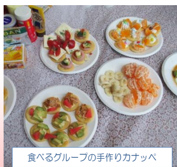
食べるグループの手作りカナッパ

恒例のクリスマスディスコ大会は12月16日に行いました。午前中は計画から全てメンバーが運営した「食べる・音楽・ゲーム」の中の好きなグループに入り、有意義な時間を過ごしました。午後はディスコ大会通称“CLUB EAST”が盛大に開催され、竹林先生を中心に楽しく踊ってストレス発散!あっと言う間の1時間でした。